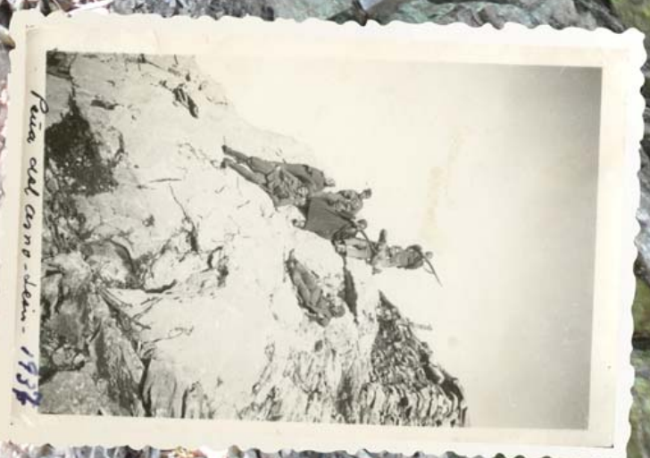
Detalle de tropas armadas en una posición estratégica de la zona

La zona de vivac estaba dotada de los elementos precisos para que las tropas pudieran sobrevivir aisladas durante un periodo de tiempo, hasta la llegada de refuerzos.