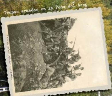
Tropas armadas en La Peña del Asno