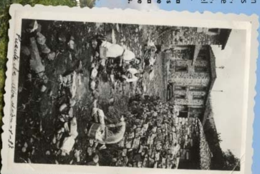
Mujeres lavando en Puente de Alba

La fotografía muestra cómo la vida en los pueblos, lejos de paralizarse, continuaba pese a la crudeza de los tiempos.