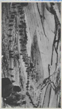
Las tropas de la 1ª Brigada de Castilla descendían hacia Los Barrios de Gordón, una vez roto el frente republicano que defendía la sierra.

La parte Norte de la provincia de León y, en particular, sus cuencas mineras- se mantuvo leal al Gobierno de Madrid, constituyéndose en las diferentes localidades los comités de Frente Popular que se convirtieron en el poder de facto de la zona. Esta recibió el apoyo inmediato de sus correligionarios asturianos, cuya influencia desbordó desde el primer momento la Cordillera Cantábrica, permaneciendo en ella buen número de los componentes de la expedición minera enviada desde Oviedo a Madrid el mismo 18 de julio que había frustrado la sublevación de la guarnición militar de León.