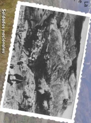
Soldados nacionales contemplando desde lo alto Los Barrios de Gordón, ya ocupado... o a punto de serlo.

Por su parte, dicha guarnición de León tuvo que dedicarse por entero a contener la expansión de los partidarios del Gobierno que controlaban el Norte de la provincia, frenándoles en algunos puntos y haciéndoles retroceder en otros hasta constituir un frente defensivo que, en la zona central, por la que cruzaba la carretera nacional Adanero-Gijón, quedó establecido en Puente de Alba, a vanguardia de La Robla, localidad esta última que las tropas de León ocupaban el 1 de agosto.